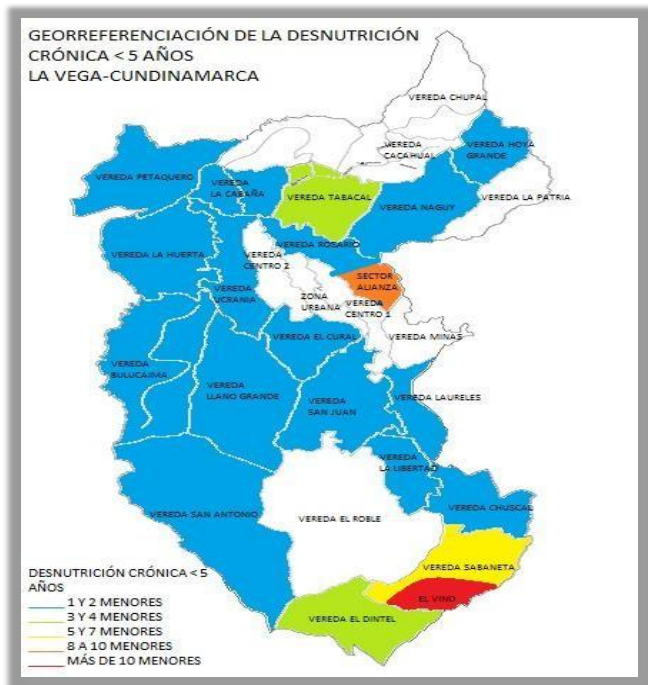
Gráfico No 1. Georreferenciación de desnutrición crónica en población menor de 5 años Año 2014.

En el análisis situacional de nutrición del año 2014 en el Municipio de La Vega en la población menor de 5 años con desnutrición crónica se encuentra la zona 1 con las veredas Sabaneta, El Dintel y la Inspección El Vino con mayor número de casos, mostrando la necesidad de realizar acciones en seguridad alimentaria en prevención y atención en dicha población específica.